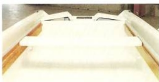
5 Les bancs de 30 cm de largeur qui s'accrochent par simple pression sur les équipets latéraux pourront devenir, mis côte à côte, une magnifique plage de bain de soleil