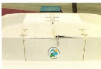
1 Un coffre avant qui pourra recevoir tout le mouillage nécessaire à bord

ZA LES PEUPLIERS - 13670 VERQUIERES - TEL 90.95.15.91 - FAX 90.90.29.14