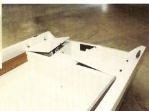
2 Le coffre arrière permet de loger batterie, réservoir, et le matériel de sécurité