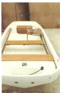
3 Pupitre latéral bas [3] ou console centrale avec pare-brise [4] sont aussi au programme pour mieux personnaliser votre bateau